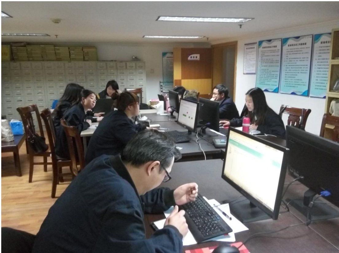
图 1 毕业实习工作环境

重庆高南房地产信息服务有限责任公司是重庆市国土资源和房屋管理局下属国有企业，位于重庆北部新区汽博中心凯比特大厦。该公司是重庆市经济和信息化委员会认定的“双软”企业，主要从事房地产经纪咨询、档案数字化加工、计算机软件开发，计算机网络技术服务等经营。参加本次毕业实习的同学主要分配处理巴南区、沙坪坝区和九龙坡区不动产项目（图 1）。