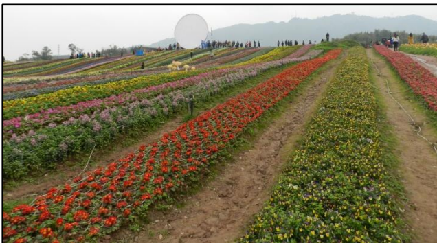
图 3 黄桷门奇彩梦园四季花海区

下午，结合学院风景园林专业特点，学院分工会组织教师参观了奇彩梦园（图 3）。学院风景园林专业的教师不时从专业的视角，用通俗和简略的语言给老师们进行介绍与说明。在飘逸清幽的花香中，大家一边尽情游园、赏花、赏景，放飞心情；一边修身养性，体会各种心旷神怡。