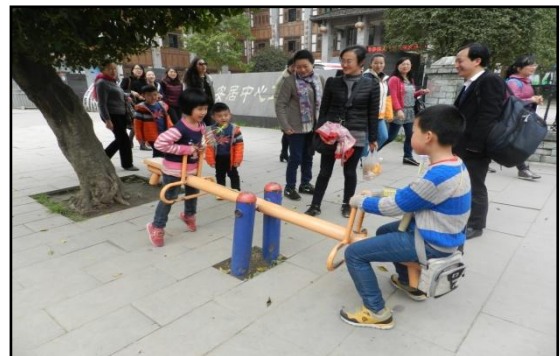
图 4 学院教职工团结和谐、放飞心情

参观完毕，大家在欢声笑语中踏上了回家的路。“春日乡间走，能活九十九”。此次活动，不仅让大家在紧张的工作之余放飞心情、领略大自然的美好，同时还结合学院学科专业特色进行了非常有益的实践；更为重要的是增进了新学院教师间的情谊，让大家感受到“教工之家”的融融乐趣与和谐温馨。